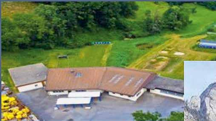
Schiessanlage Schohl 7320 Sargans